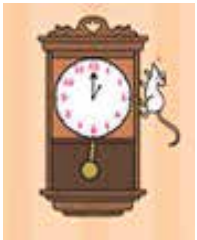
Temat komunikacji Aistear

[w dosłownym tłumaczeniu] Hickory Dickory dock, mysz wskoczyła na zegar Zegar wybił pierwszą, Mysz zbiegła w dół, Hickory Dickory dock