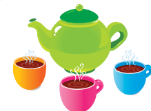
Motyw Aistear Tożsamość i przynależność