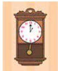
Temat komunikacji Aistear

[w dosłownym tłumaczeniu] Co mówi zegar w holu...? Tik tak, tik tak Co mówi zegar na ścianie...? Tik, tak, tik tak, tik, tak Co mówią wszystkie zegarki...? Tick-a-tic-a-tic-a-tic-a-TOCK!