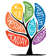
Temat komunikacji Aistear

[w dosłownym tłumaczeniu] Niedziela, Poniedziałek, Wtorek też. Środa, Czwartek tylko dla Ciebie. Piątek, Sobota to koniec” A teraz powtórzmy od początku!